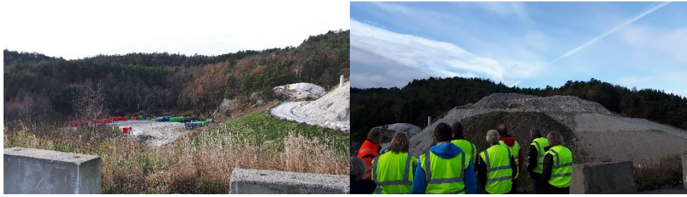
Kontrollutvalgene fikk omvisning på deponiet på Knudremyr