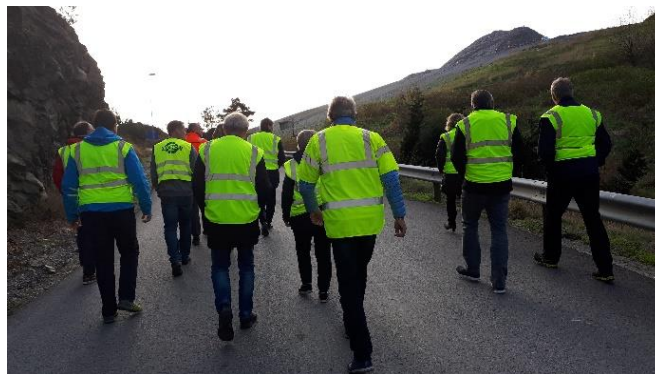
Figur 1 Kontrollutvalgene på bedriftsbesøk

Revisjonen var også tilstede på felles virksomhetsbesøk hos LiBiR IKS med kontrollutvalgene fra Birkenes og Lillesand kommuner. Her fikk kontrollutvalgene en omvisning på Knudremyr og en presentasjon av selskapet. Informasjonsmaterieell ble også delt ut. LiBiR IKS har hatt rapporten til en gjennomgang av fakta.